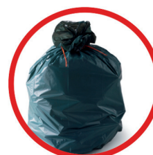
Sacs-poubelles et sacs plastiques