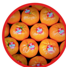
Étiquettes de fruit