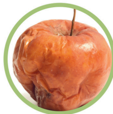
Fruits et légumes