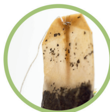
Sachets de thé et marcs de café