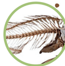
Arêtes, restes de poisson et fruits de mer