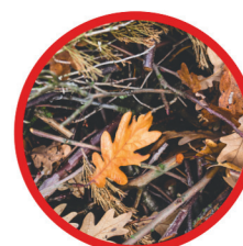
Feuilles et branchages