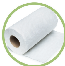
Essuie-tout et serviettes en papier