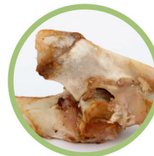
Os et restes de viande